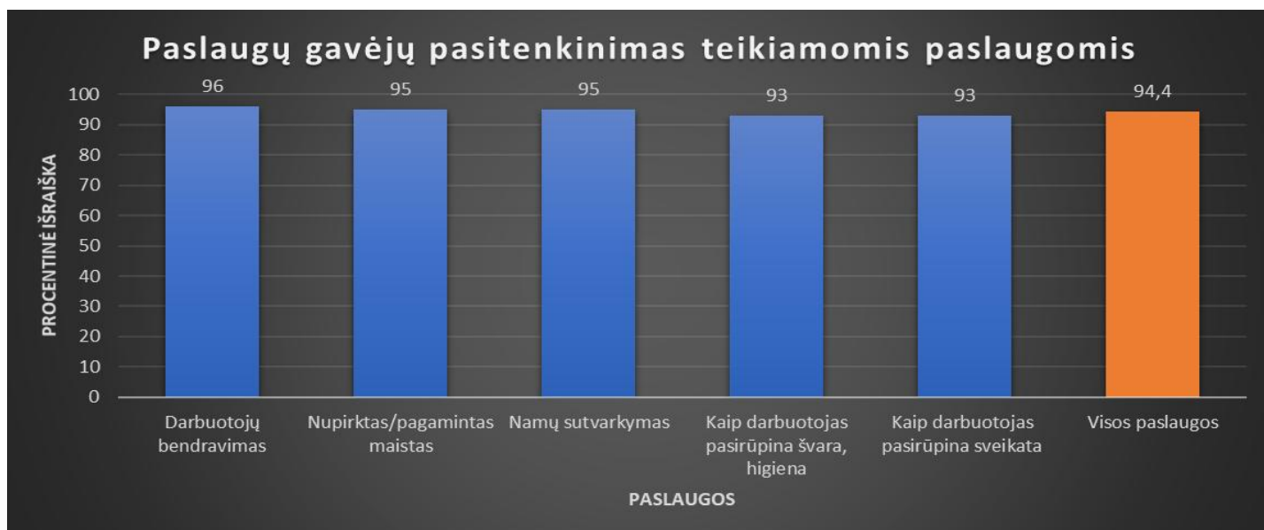
2 paveikslas. Paslaugų gavėjų pasitenkinimas darbuotojų bendravimu 2019 m.

Rezultatai gauti tai pat iš anketinės paslaugų gavėjų namuose apklausos, kuri vyko 2019 m. lapkričio mėn.